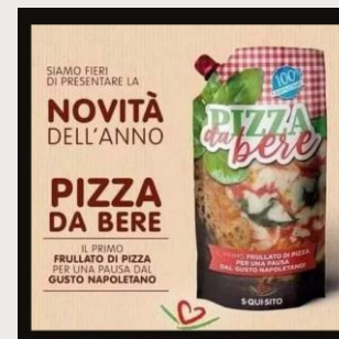
Pizza koja se pije

U današnjem svetu gde je „sve već viđeno“, kombinacije ukusa koje iznenađuju dobijaju na popularnosti, kao što su slatko-slano, neočekivane kombinacije do juče „nespojivih“ ukusa, oblika i kombinacija, kao što su na primer sladoled sa ukusom slanog flipsa ili čak i pizza koja se pije.